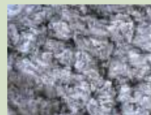
セルロースファイバー(断熱材の一例)