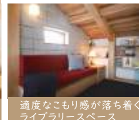
適度なこもり感が落ち着くライブラリースペース