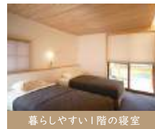
暮らしやすい1階の寝室

広葉樹と芝生のお庭を眺めながら心地よい光や風、内と外の繋がりを感じられる場所。雨や雪をしのぐ軒の深さも体感。