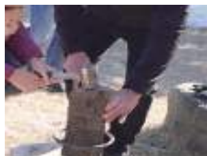
薪割り体験 (斧とキンドリングクラッカーで)