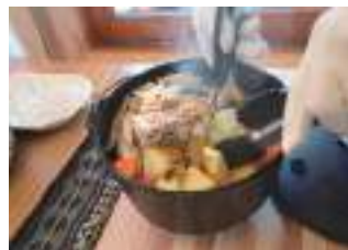
薪ストーブ料理の試食