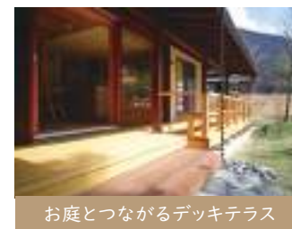
お庭とつながるデッキテラス

無駄な廊下や間仕切りがなくのびやかな間取りで、家全体が温度差の無い空間に。自然と家族のコミュニケーションが生まれます。