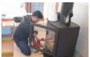
着火方法について