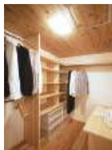
寝室の隣に設けたクローゼット