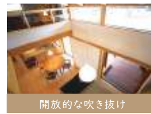
開放的な吹き抜け

家じゅうがほっとする暖かさに。揺らぐ炎を眺めながら、家族団らん。心豊かな時間をお過ごしください。