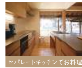
セバレートキッチンで料理

1階と2階で会話も楽しめ、家族のコミュニケーションが生まれます。家全体が明るく温度差の少ない空間に。