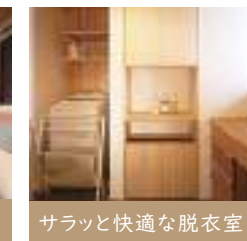
サラッと快適な脱衣室