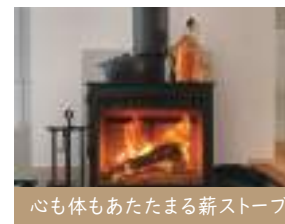
心も体もあたたまる薪ストーブ

家じゅうがほっとする暖かさに。揺らぐ炎を眺めながら、家族団らん。心豊かな時間をお過ごしください。