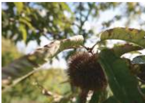
薪ストーブのまわりで渋皮煮作り

(奥 様) リノベ後はどこにいても人の気配が感じられていいなと。というのも、以前は居間が狭かったので、私はすぐに2階の自分の部屋に行くことが多かったんです。でも開放的な広さになり、ゆったりとリビングの椅子に座ってパッチワークや編み物をするのが、あったかいし最高。