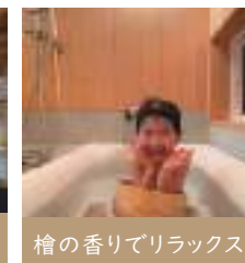
檜の香りでリラックス