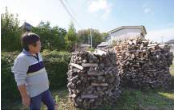
スウェーデン積みされた薪