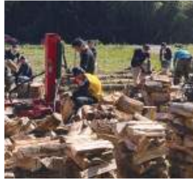
薪人会の活動風景