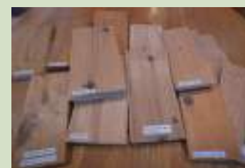
素材の異なる木材のサンプル