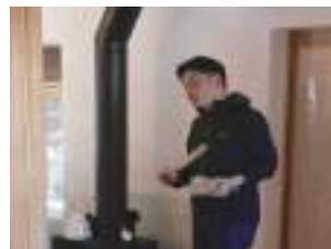
薪ストーブ専門店スタッフ によるお話