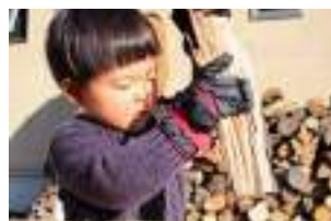
薪の調達方法について