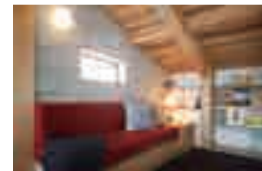
適度なこもり感が落ち着くライブラリースペース