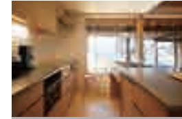
セパレートキッチンでお料理

無駄な廊下や間仕切りがなくのびやかな間取りで、家全体が温度差の無い空間に。自然と家族のコミュニケーションが生まれます。