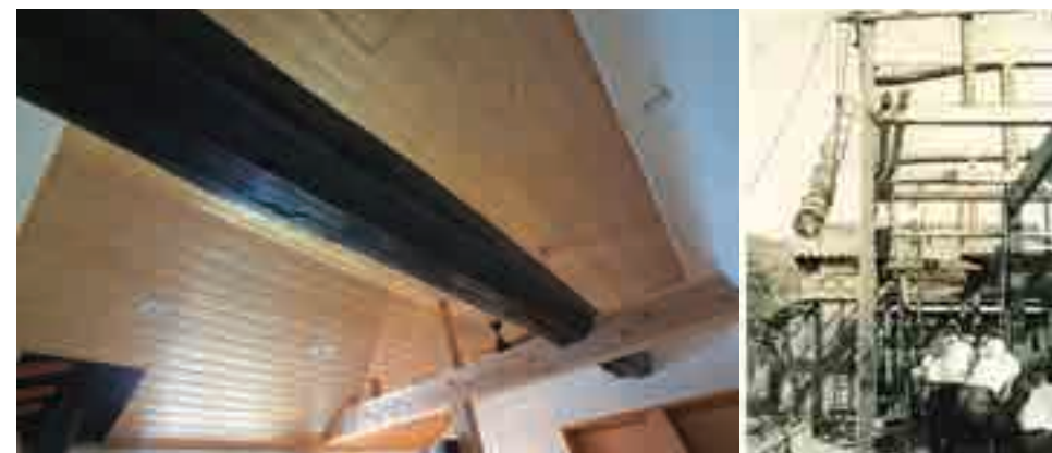
昭和37年 上棟の様子

築57年だった前の家は奥へ奥へと増築を繰り返したことで、使い勝手も悪くなっていました。土地が低く、大雨の時には床下浸水の心配もあり、耐震にも不安があったため新築することに決めたのですが、正直なところ、父が建てた家を自分が壊してしまうことに、ものすごく抵抗がありました。ですが、こんなふうに梁を入れていただけて、本当に嬉しかったです。解体したときに、梁には父の名前や上棟日が見え、当時の両親の想いを強く感じました。「残せて良かった」と梁を見上げる度に思っています。