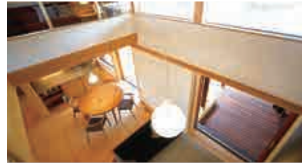
開放的な吹き抜け | 1階と2階で会話も楽しめ、家族のコミュニケーションが生まれます。家全体が明るく温度差の少ない空間に。