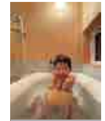
檜の香りでのリラックス