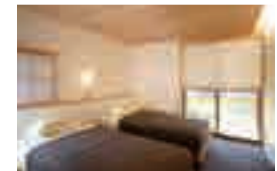
暮らしやすい1階の寝室

2階に上がらなくていいので便利。ウッドデッキへも出入りできお布団も干しやすい。お庭も眺められれます。