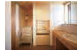
サラッと快適な脱衣室