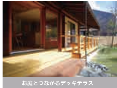
お庭とつながるデッキテラス

洋服や車を試すように、何十年と暮らす家だからこそ住み心地を試すことは欠かせないのではないのでしょうか。響の杜では、森の木々を活かし庭と建物が一体となった、自然を感じられる暮らしが体感できます。また、平屋のような作りは、数十年先も暮らしやすく、どんな年代の方にも心地よく暮らせる工夫が詰まった住まいです。ぜひ、ご家族でゆっくりご宿泊いただき、住まいづくりの参考にしてください。