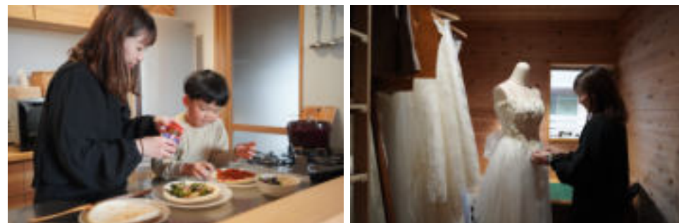
舞台衣装製作をされている奥様の作業部屋。