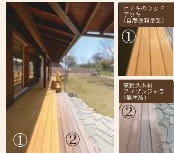
昨年オープンしたモデルハウス「響の杜」。大きな庇の下にある2種類のウッドデッキ。

雨が多くかかる場所には海外の木ですが「ハードウッド」と呼ばれる高耐久木材もおススメです。モデルハウス「響の杜」では大きな軒下空間にウッドデッキを設けています。素材の違いや実際の肌触り、心地よさを感じていただくことが出来ますので是非ともお越しいただき実際に触れていただきたいと思います。