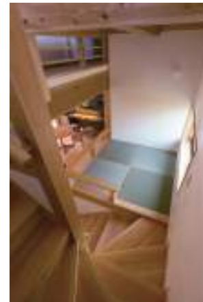
「3つのスキップフロアが楽しい家」