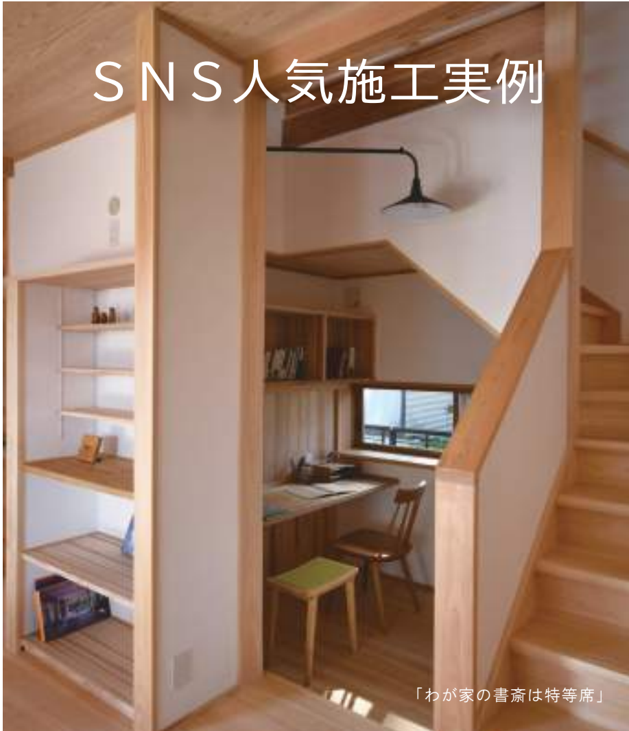
「わが家の書斎は特等席」