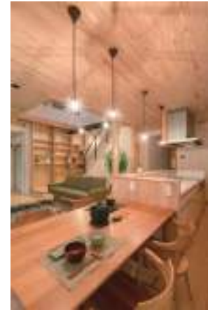
「大きな吹き抜けで開放的に変わった ベレットストーブのある暮らし」