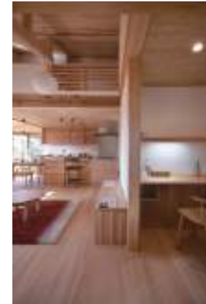
「集まりたくなる家、また来たくなる家」