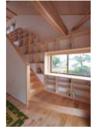
「図書館のような本棚のある家」

コロナ禍により在宅ワークが増えた影響で、「書斎」や「半個室」へのニーズが高まっているように感じます。これまで以上におうち時間を大切に考えるご家族が増え、「私たちがらしく暮らしたい」と家づくりをお考えの方は、その過程で1つのツールとしてこのようなSNSを上手く活用していただけたらいいなと思います。そして、やはり百聞は一見に如かず！実際のお住まいを見て感じていただきたいです。