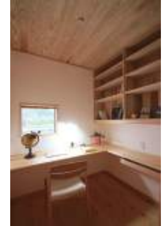
「地域の人たちと子育てができる 田舎暮らし」