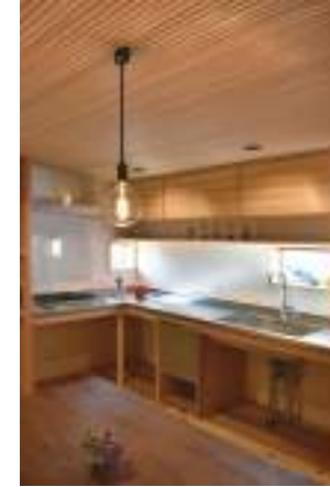
「シンプル洗い大人の木の家」