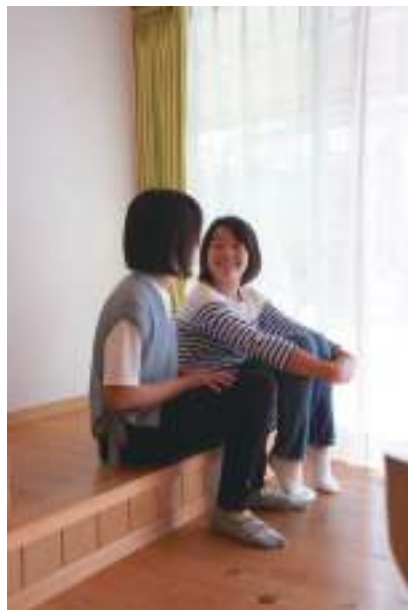
階段付近の段差はベンチのように腰掛けられます

出来るだけシンプルに建てたいという想いをお伝えし、提案して下さったプランの模型を見て「こんな間取りがあるんだ！私たちの想いにドンピシャやね！」って。「寝室は2階にあるもの」と思っていたのですが、プランは寝室が「1階」に！2階は共有スペースで家全体が繋がっているシンプルで無駄のない間取り・・・想像もしなかったプランに驚きました。実際に住んでみて1階に寝室があるとこんなに便利なんだ！と実感しています。子どもが巣立っても夫婦2人で安心して暮らせる家ができて本当に良かったと思います。