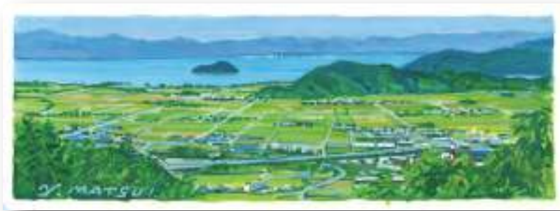
絵: 松井 善和さん

小谷城の史跡があるので、戦国時代の雰囲気を感じながら登山ができます。山頂は見晴らしが良く、絶景が広がっています。