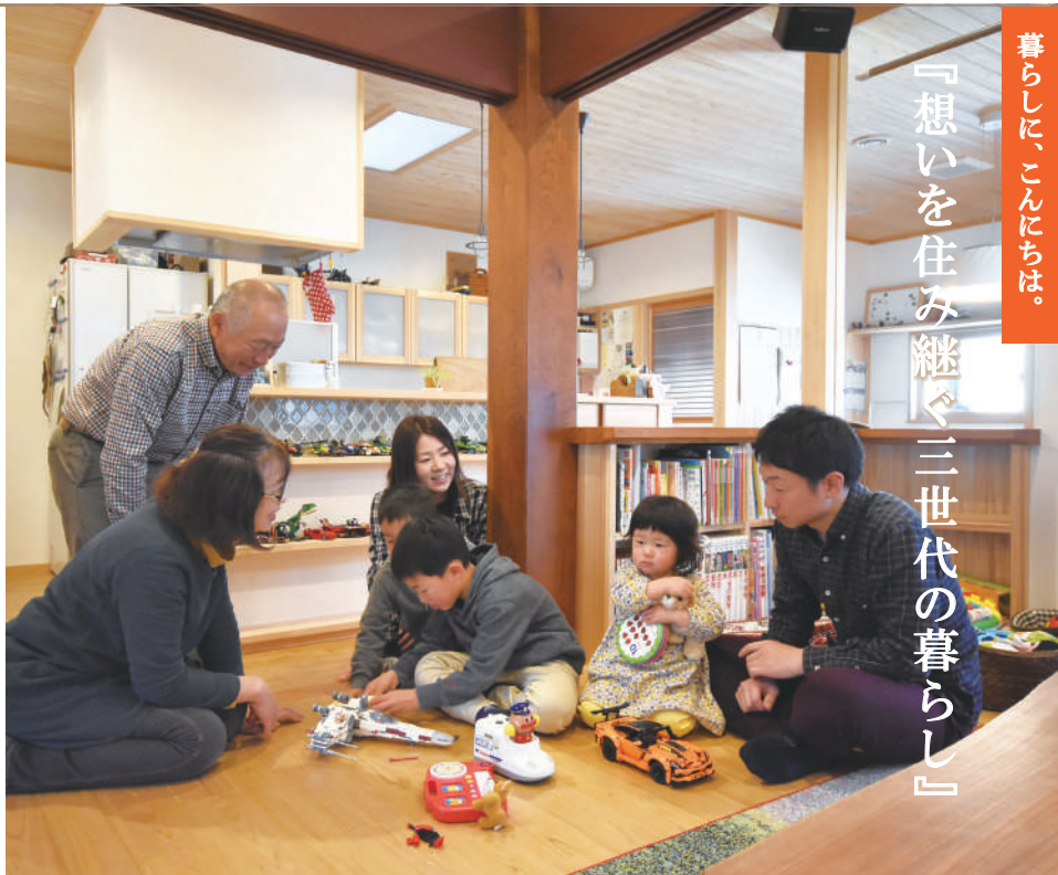
◆長浜市S様邸（2017年12月竣工） ◆ご家族/ご主人、奥様、お子様3人、ご両親

築50年ほどの田舎建ちのお住まいを、増築やリノベーションをしながら住み継がれていたS様。三度目の大改造で生まれ変わったお住まい。現在の暮らしをお聞きしました。