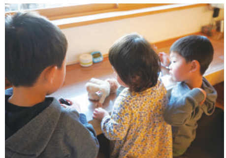
ケヤキのカウンターは子ども達のお気に入りの場所

祖父が残してくれたケヤキの木材は他にもたくさんあって、製材したらどれも新しい材料のように美しくなり、ケヤキの魅力に改めて気づきました。自分も次の代に繋げられたらと、新たにケヤキの長い一枚板を選び、家族で囲めるテーブルとワークスペースのカウンターに使ってもらいました。子ども達はまだ幼いですが、いつかその良さを感じてくれるといいなと思います。