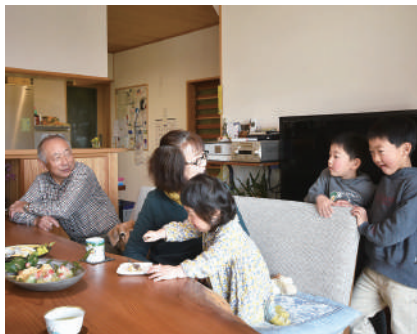
母家と隠居の行き来を楽しむ子ども達

空間が広くなつて子ども達も走り回って遊べるようになりまして。母屋と隠居がつながっているの、何かあると、子ども達はすぐじいちゃんやばあちゃんのところに行ったり。子どもにとってはすごくいい環境だと思っています。昔は普通だった三世代の暮らし、今は貴重かもしれませんね。毎日がとても幸せです。