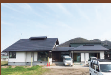
5/30(土)・31(日) 見学会予定邸

【新築・リフォーム・その他工事】 建築中のお住まいをご見学ご希望の方は、事前にご連絡ください。