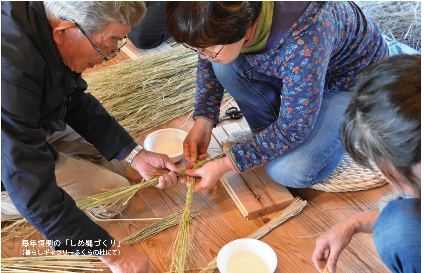
毎年恒例の「しめ縄づくり」 (暮らしギャラリーふくらの社にて)