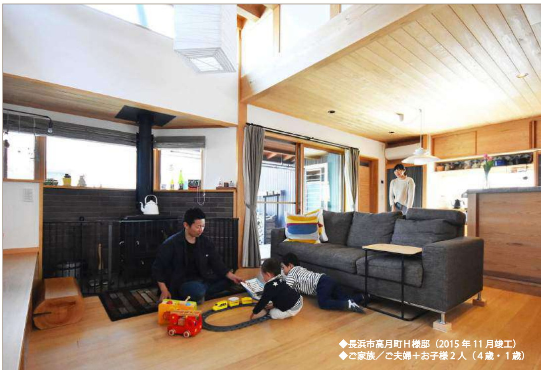
◆長浜市高月町H様邸（2015年11月竣工） ◆ご家族／ご夫婦+お子様2人（4歳・1歳）

ご出産をきっかけに家づくりをされた共働きご夫婦のH様 お住まいになられて3年半、ご家族も増え、『元気になる 家』の現在の暮らしをお聞きました。