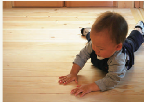
無垢の木 (ヒノキ) の床。安心、安全な塗料を。

小さなお子様はゴロゴロ寝転がったり触ったり、ハイハイしたりと床に近い暮らしをしています。特にお子様が居られるご家庭では、無垢の床などの心地よさを「触覚」「嗅覚」「視覚」などの五感で感じながら、心身の成長に役立ててもらえれば最高です(^^)