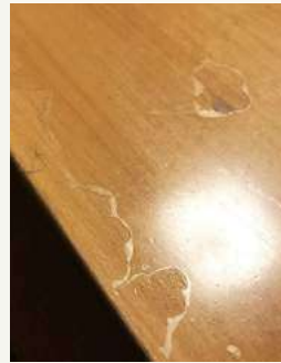
表面のウレタン塗装がはがれてしまった新材

小さなお子様はゴロゴロ寝転がったり触ったり、ハイハイしたりと床に近い暮らしをしています。特にお子様が居られるご家庭では、無垢の床などの心地よさを「触覚」「嗅覚」「視覚」などの五感で感じながら、心身の成長に役立ててもらえれば最高です(^^)