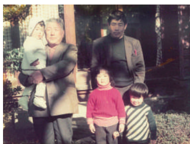
▶初代(祖父)、2代目(父)、姉、弟と。 《昭和49年頃》