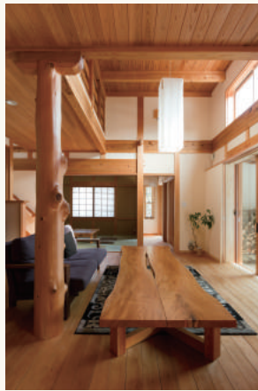
竣工から13年経過した「内保展示場」

これから年月とともに変化していく過程も日々の暮らしの楽しみです。実際の色艶や風合い「経年美」を見てみたいという方は、是非とも内保展示場へお越しくださいませ。