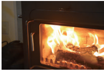
みんなで薪ストーブを囲んで 楽しいひとときを過ごしましょう♪

根強い人気の薪ストーブですが、暖かいのはもちろん、ゆらゆらと揺れる炎を見ていると、何だかほっこりしますね。薪ストーブを入れてみたいけど、実際はどうなの？大変なのかな？薪ストーブでお料理ができるの？そんな疑問を解消して、ゆっくりと心温まるひと時を過ごしませんか。薪ストーブに興味のある方、薪ストーブオーナーさんも、ぜひ、遊びにいらしてください。