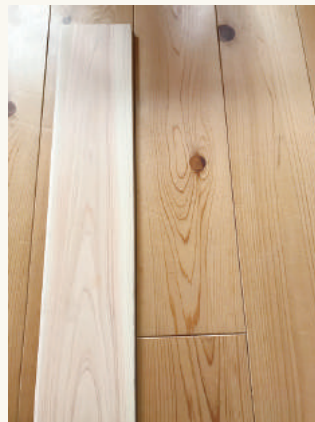
経年美 (ヒノキの無垢材)

「経年劣化」と「経年美」このどちらもが、「光」が当たることによるものというの面白いところです。塗料などの成分を分解して劣化させる光のチカラが、木の成分リグニンなどを変化させて色艶など、木の風合いを増していくのです。