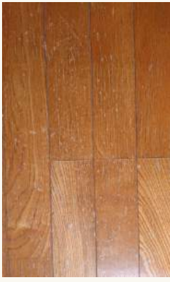
経年劣化した新材の床

それに対して無垢の木は年月を経るほどに色濃く、深みのある艶へと変化していきます。↓「経年美」