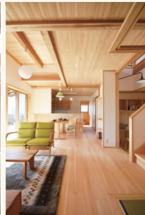
長浜市A様邸 (2018年12月竣工)

先日完成したばかりのお家「神照の家」、まだまだ新しい木の色合いです。内保展示場の10年以上経った様子と比べるとその差がはっきりとわかります。