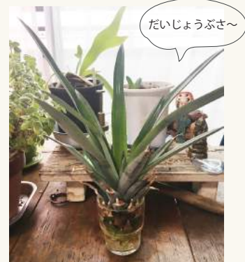
尖った葉は、小さなお子様のおられるお家では心配なので思いきって切っても大丈夫です！！

写真の多肉植物の鉢。これは親株から落ちてしまった葉を土の上に置いて育てたものです。落ちた葉を育てること数週間後、葉から小さな葉と根が出てきました。2年経った今では立派なグリーンポットになりました。