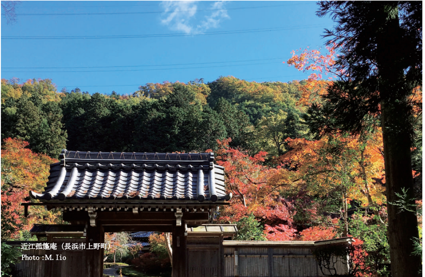
近江孤蓬庵（長浜市上野町）