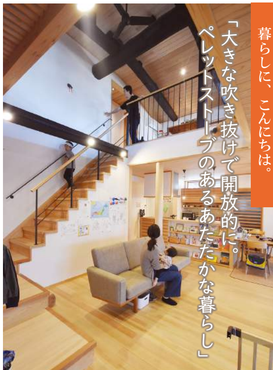
■長浜市Y様邸（2015年12月竣工） ■ご家族/ご夫婦+お子様3人

田舎建ちのお住まいの一部をリノベーションされて、2年10カ月。住まいづくりや現在の暮らしについてお聞きしました。