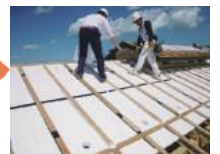
検査員にてチェック