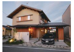
◇米原市宇賀野 0様邸 2015年5月竣工 ◇ご家族：ご夫婦+子ども1人

薪ストーブの出番ももうすぐ・・・という肌寒い秋の日に、米原市O様のお住まいを訪ねました。『大好きな車と薪ストーブのあるくつろぎ時間』がコンセプトのお住まい。どのように木の家の暮らしを愉しまれているのか、ご夫婦にお聞きしました。