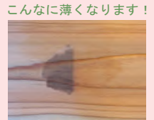
お酢で拭くと・・・