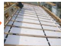
エアパス通気層工事