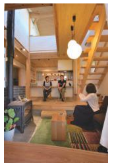
薪ストーブの炎を眺めてリラックスタイム

この家にはちょっと遊びの部分があつて、吹き抜けも床を貼ったらもう一部屋というところだけども、むしろここがあつたおかげでいろいろ暮らしが