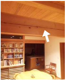
梁の割れ（暮らしギャラリーふくらの杜）

山に「植物」としてたつぷり水分を含んで立っていた木が、「木材」として第二の人生を送るときもう水分は吸収しませんので、外側から乾燥が進んでいきます。