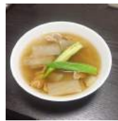
写真：本庄が作りました

夏から秋へのこの季節は体調を崩しやすい季節でもあります。食も秋向きへ切り替えていきましょう。夏野菜は体を冷やす効果があるので暑い季節にはお勧めですが、これからの季節は夏の疲れで胃腸も弱っている可能性もあります。