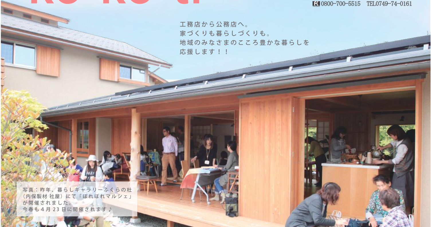
写真：昨年、暮らしギャラリーふくらの社（内保製材 社屋）にて「ぼれぼれマルシェ」が開催されました。今春も4月23日に開催されます。

工務店から公務店へ。 家づくりも暮らしづくりも。 地域のみなさまのこころ豊かな暮らしを 応援します！！