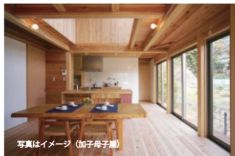
写真はイメージ (加子母子)

国産材 100%の本格的な木の家を徹底的な合理化と規格化により建物本体 1,800 万円からご提案。