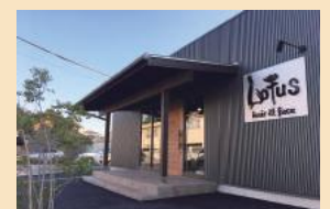
理髪店。自然素材をふんだんに使用