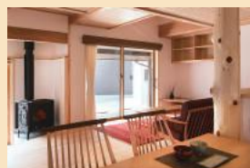
冬も薪ストーブで家中暖かい