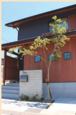
木の家に似合うお庭の工事もお提案