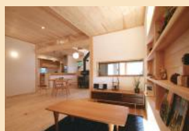
感性を育む自然素材の空間