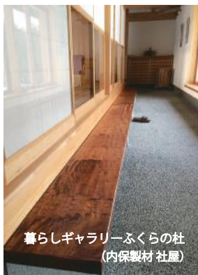
暮らしギャラリーふくらの杜 (内保製材社屋)

住宅でのケヤキの使用は少なくなってきましたが感響の家では、造作材や造り付け材などで使用しています。玄関の上櫃や敷台、又、カウンター材等に使用するとケヤキの独特の色艶や木目、存在感がアクセントになり、感響の家にはしっくり似合うと思います。