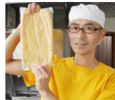
②あぶらあげ大1枚 325円