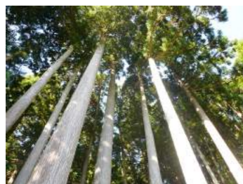
森林に入ると気分が落ち着きませんか？それは樹木から発散されるフィトンチッドという成分により、癒しや安らぎを感じるから。木材が家に使用された後もその効果は続きます。

この十月八日には森林と製材を皆さんと共に見聞するツアーを実施します。あらためて、森林のことを知るきっかけにしてくださいと思います。