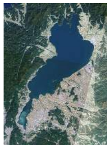
びわこ材を使用した住まいづくりが、地域の森林を守ることに繋がります！