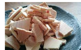
当社の建築端材を使用

生活の匂いは、そこに住んでいる人には気づきにくいもの。なんと、宅配業者の84.5%が『玄関の匂いでその家と住人の印象を決めている』そうです。（エキサイトニュースより） かといって、芳香剤は人工的でキツク感じてしまいます。そこでおススメなのが、『ウッドチップ』。良い香りの玄関、第1位が『ヒノキ・スギなどの自然の木の香り』だそう。（ガジェット通信調べ）ヒノキチップなどの木片をお気に入りの器に入れてみては？純度の高いヒノキのアロマオイルをプラスするのもいいかもしれませんね。 また、コーヒー好きの私オススメの方法！挽いたコーヒー豆を器に盛ると通るたびにフワッと良い香りに癒されます。（ドリップ後を乾燥させてもOK）