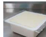
①絹ごしとうふ 300g 215円 つるりとした滑らかな触感、すっきりした大豆のコク。